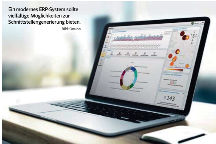
Ein modernes ERP-System sollte vielfältige Möglichkeiten zur Schnittstellengenerierung bieten.

Mit ETL-Tool (Extract-Transform-Load) lassen sich auf komfortable Weise unterschiedlichste und sehr dynamische Schnittstellen kreieren. Dazu werden Daten einer Datenquelle zuerst extrahiert, dann umgewandelt bzw. transformiert und am Ende in ein Ziel also bspw. eine Datenbank geschrieben. Der ETL-Prozess erhält seine Flexibilität und Dynamik dadurch, dass das Format von Ziel und Quelle beliebig sein kann. Beispielsweise können Informationen aus einem Excel-Dokument extrahiert und in die ERP-Datenbank übernommen werden. Ebenso lassen sich Daten aus dem ERP bspw. in Form eines CSV-Dokuments exportieren, damit sie von anderen Anwendungen weiterverarbeitet werden können. ETL ist vor allem für den Import und Export von Stamm- und Bewegungsdaten geeignet.