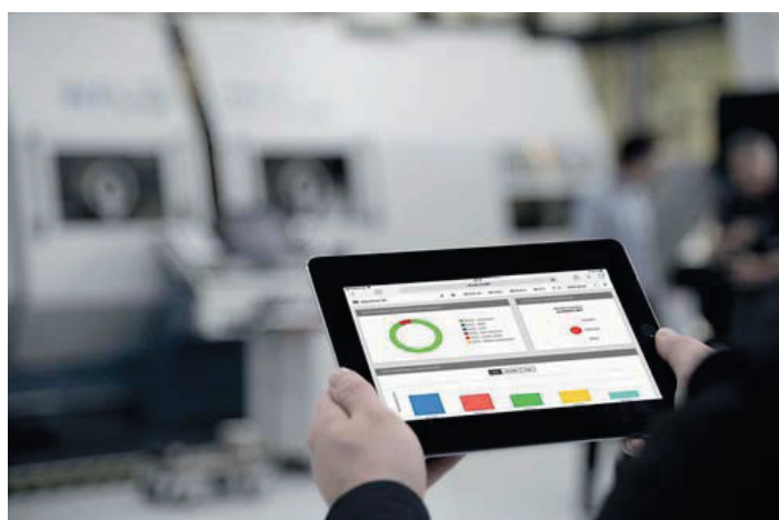
Walter Nexxt: Digital Manufacturing in der Praxis.

Walter ist bekannt als Hersteller von Premiumwerkzeugen zum Fräsen, Drehen, Bohren und Gewinden.